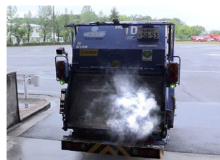
「ごみ収集車車内の発火」 事故の再現