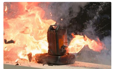
電動アシスト自転車用バッテリーが発火する様子

リコール対象製品の電動アシスト自転車用のバッテリーにおいて、バッテリー内部の湿気が電池セルのつなぎ目から浸入し、内部ショートが生じて異常発熱し、発火した。