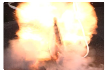
インターネットで購入したモバイルバッテリーが発火した事故の再現