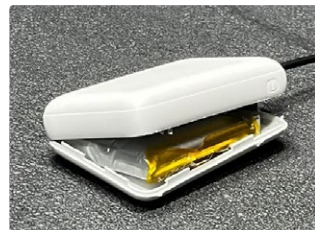
膨張した モバイルバッテリー

また、(一社)JBRCの会員企業製のリチウムイオン電池(表面にリサイクルマークの表示のあるもの)は、家電量販店やホームセンター等の協力店や協力自治体による回収も行われていますので、回収している販売店等に持っていくようにしましょう。