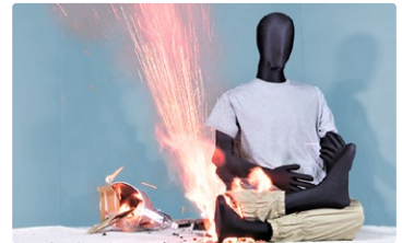
充電式掃除機のバッテリー発火事故の再現