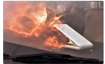
自動車内でモバイルバッテリーが発火する様子