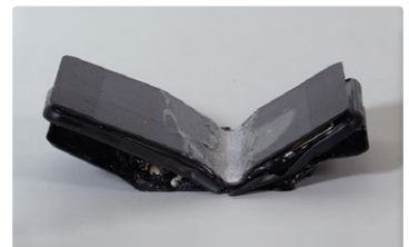
外部からの力により発火・燃焼したスマートフォン

階段で足を滑らせて尻もちをつき、ズボンの後ろポケットに入れていたスマートフォンのバッテリーパックが破損して短絡を起こし、衣類に着火し火傷をした。