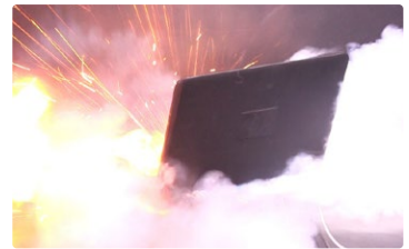
非純正品バッテリー搭載製品の発火事故の再現

非純正バッテリーに交換されていた中古品のノートパソコンをインターネットサイトで購入、充電中にバッテリーパックから出火し、周辺を焼損させた。